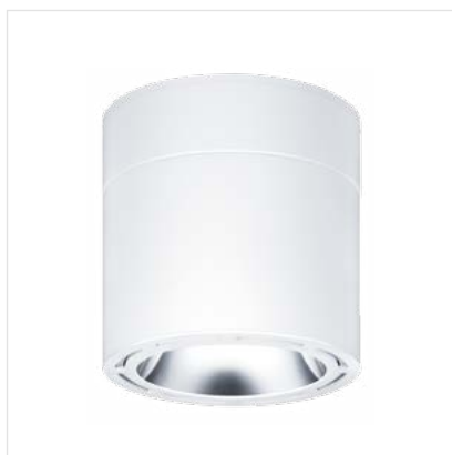
Chalice Pro HO

这款高输出的 LED 筒灯是 HID 灯具的理想替代品，适合安装在交通枢纽和购物中心等高天棚的场所。