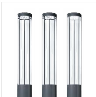
Alumet Control Direct