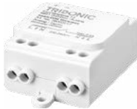
basicDIM Wireless Repeater pour augmenter la portée ou pour intégrer des interrupteurs muraux classiques existants