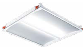
IQ Wave encastré