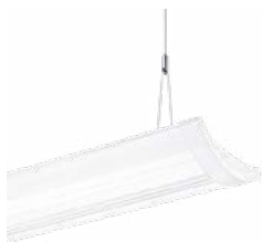
IQ Wave suspendu