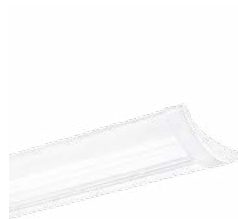
IQ Wave plafonnier