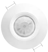
Capteur basicDIM sans fil pour la présence et la lumière ambiante