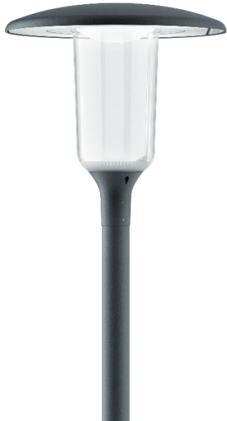
Aerie Slim Clear med diffusor för trivsel