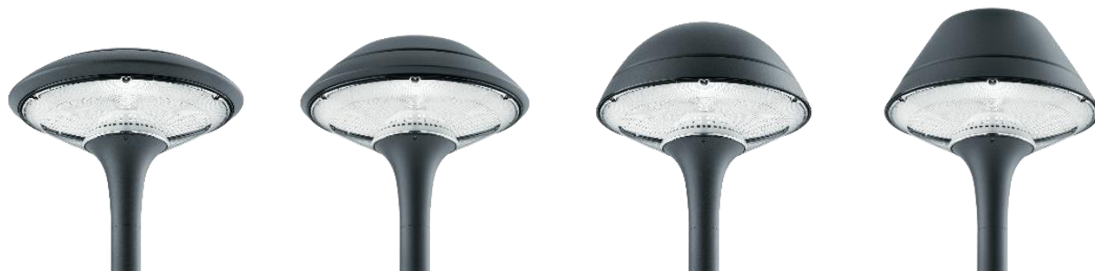
Plurio LED est disponible en modèles différents