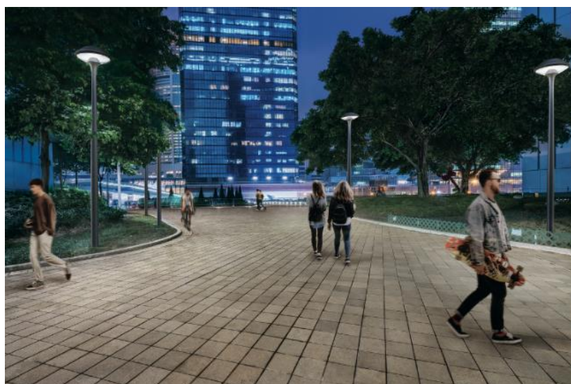
Le modèle Plurio LED Indirect peut être équipé de la nouvelle technologie innovante NightTune de Thorn, qui ajuste l'intensité lumineuse et la température de couleur en fonction de l'heure de la nuit et de la circulation