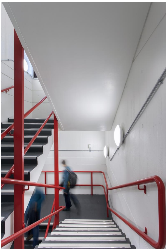
Abbildung 2: Die Leuchte Novaline von Thorn sorgt mit der richtigen Lichtstärke für eine sichere Treppenhausbeleuchtung.