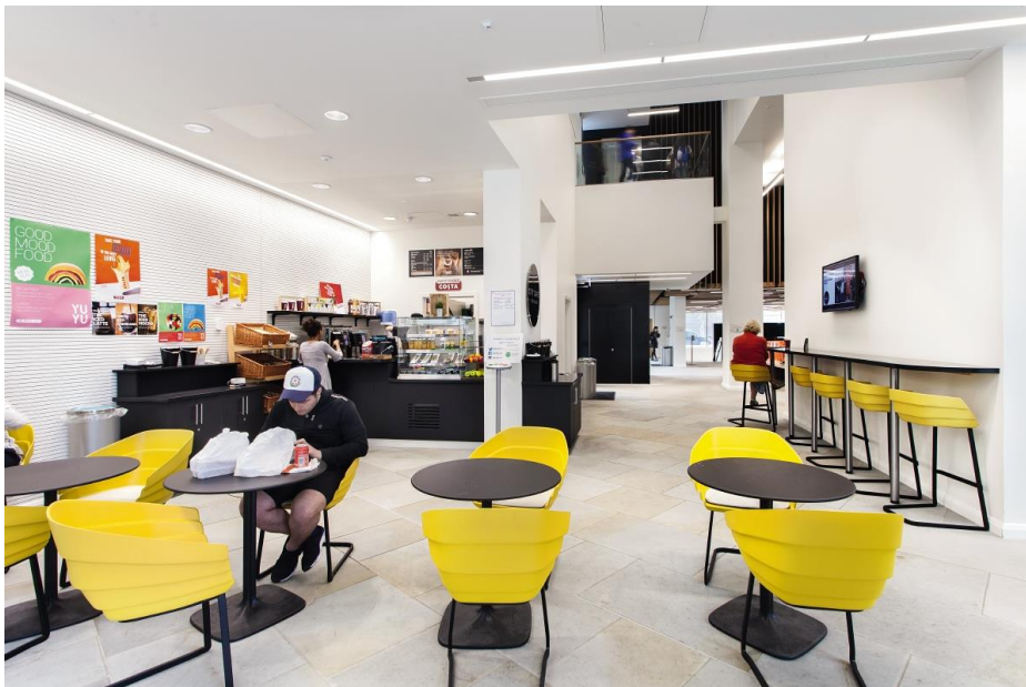
Abbildung 4: Die Einbauleuchten Chalice und Equaline sorgen für eine freundliche Atmosphäre im Café.