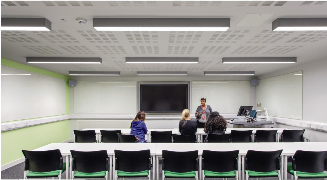
Abbildung 1: Die Anbauleuchte Equaline schafft eine helle, freundliche Raumatmosphäre, ideal für Workshops, Präsentationen und Lerngruppen.