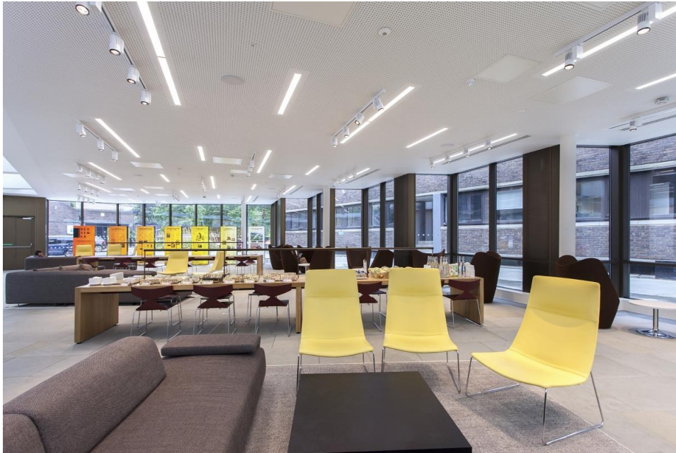
Abbildung 5: Moderne, ansprechende Aufenthaltsräume laden die Studierenden ein, sich zwischen und nach den Vorlesungen miteinander zu treffen.