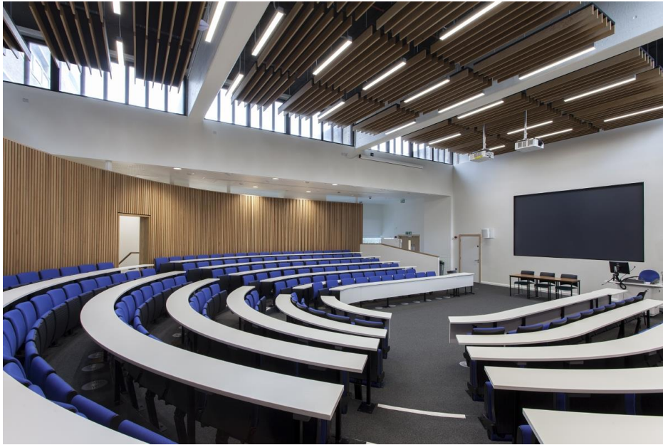
Abbildung 3: Equaline, eine LED-Leuchte von Thorn, eignet sich auch für hohe Decken, wie in Hörsälen.