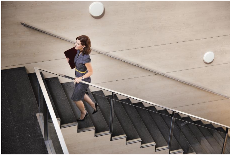
Katona doet het werk